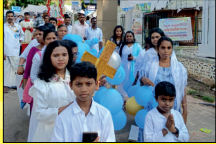
ജപമാല മാസാചാരണത്തോടനുബന്ധിച്ച് നടത്തിയ ജപമാല റാലിയിൽ നിന്ന്