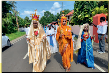
ജപമാല മാസാചാരണത്തോടനുബന്ധിച്ച് നടത്തിയ ജപമാല റാലിയിൽ നിന്ന്